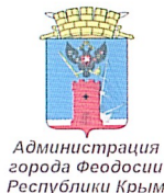
Администрация города Феодосии Республики Крым