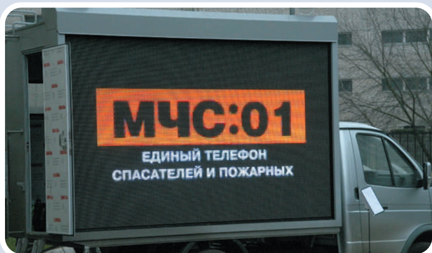
Мобильный комплекс информирования и оповещения населения