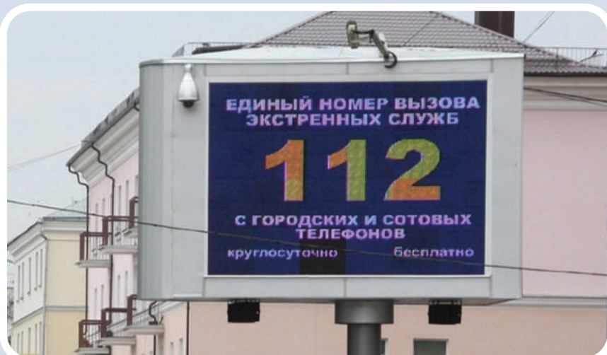
Пункт уличного информирования и оповещения населения