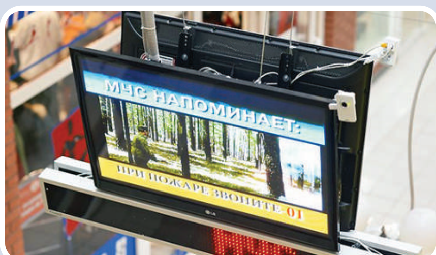
Пункт информирования и оповещения населения в зданиях с массовым пребыванием людей