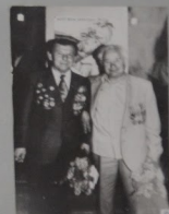
9. Встреча ветеранов в музее