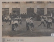
6. Встреча ветеранов