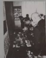
8. Встреча ветеранов в музее