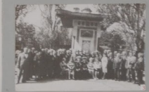
3. Встреча ветеранов в сквере у здания администрации в Горьком районе города