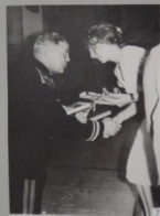
7. Встреча ветеранов в музее