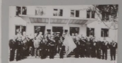
1. Встреча ветеранов в сквере у здания администрации в Горьком районе города