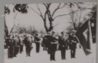
2. Встреча ветеранов в сквере у здания администрации в Горьком районе города