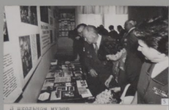
5. Встреча ветеранов в музее