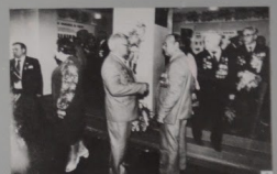
6. Встреча ветеранов в музее