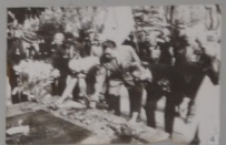
4. Встреча ветеранов в сквере у здания администрации в Горьком районе города